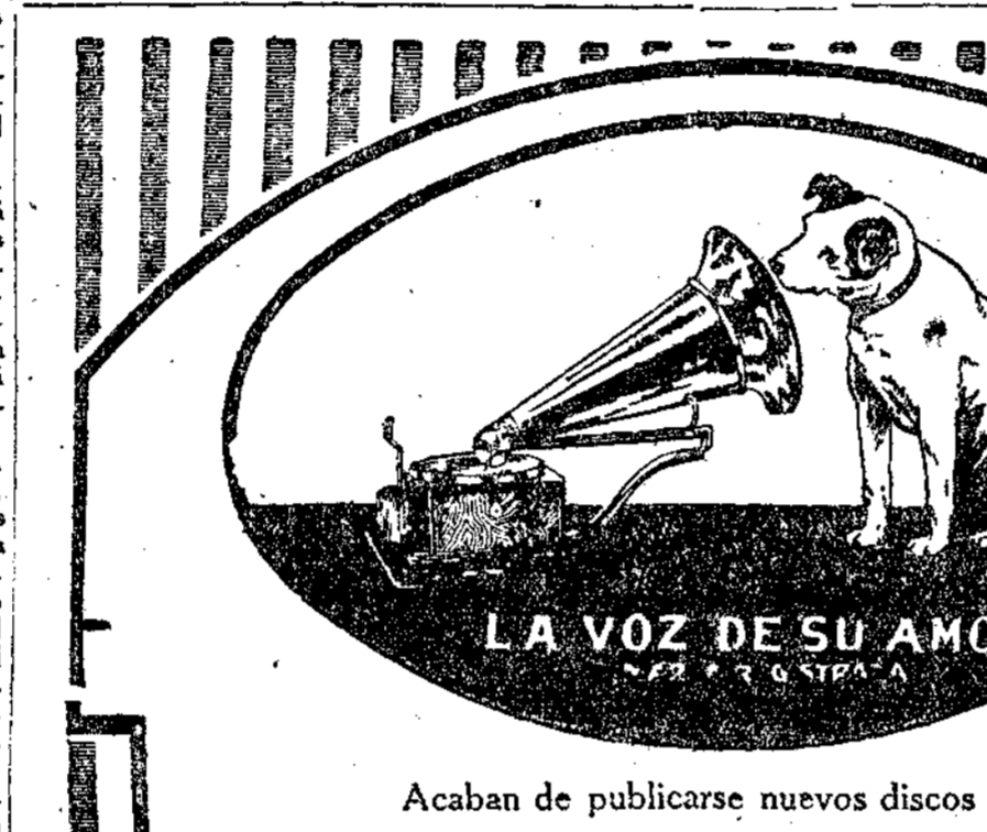
Acaban de publicarse nuevos discos marca

En un periódico suizo—la Neue Zürcher Zeitung—, con el título de "El Porvenir de los Consejos de Obreros en Alemania", y suscrita por el doctor Alfred Napp, encontramos una curiosa información sobre las interesantes instituciones que transforman en estos momentos la política social del mundo y pretenden encarnar un derecho nuevo.