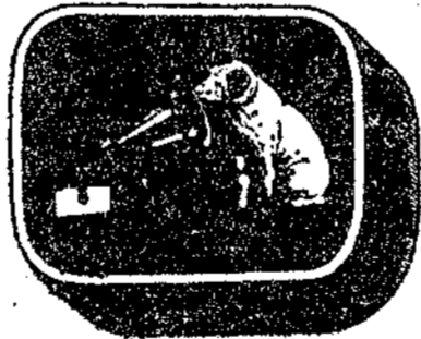
Cajita con 200 agujas: 2 pesetas

únicas que dan la audición perfecta sin estropear los discos. Exigid que cada cajita vaya provista del precinto de garantía en papel transparente y que cruza la caja.